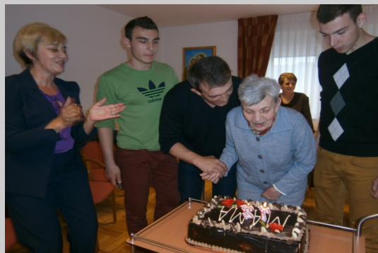
Proslava rođendana u domu "Dragi bližnji"

Dom "Dragi bližnji" nalazi se u Brodsko-posavskoj županiji, u općini Okučani te ima 29 korisnika. Osim brige za zdravlje i prehranu, korisnicima se nude i brojne aktivnosti kojima mogu ispuniti slobodno vrijeme. To su pjevanje, zanimljiva predavanja, proslave rođendana, društvene igre te razne druge manifestacije i edukativne radionice.