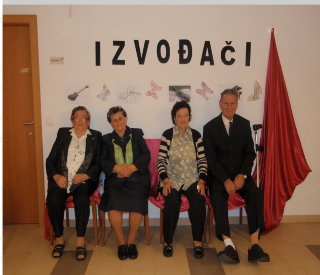
Korisnici doma "Dragi bližnji"

Dom "Dragi bližnji" nalazi se u Brodsko-posavskoj županiji, u općini Okučani te ima 29 korisnika. Osim brige za zdravlje i prehranu, korisnicima se nude i brojne aktivnosti kojima mogu ispuniti slobodno vrijeme. To su pjevanje, zanimljiva predavanja, proslave rođendana, društvene igre te razne druge manifestacije i edukativne radionice.